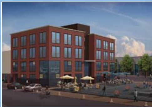
Kantoren met horeca aan het plein

Tussen de kantoorstorens in bevinden zich multifunctionele bedrijfseenheden. Deze bedrijfseenheden zijn aan de noordzijde voorzien van in het oog springende entrees welke in twee varianten worden aangeboden. Aan de achterzijde komen ruime expeditie- en entree-mogelijkheden. Boven het gehele oppervlak van de bedrijfsruimten, die ontworpen zijn met een vrije overspanning van 12,00 m en een verdiepingshoogte van 4,80 m, bevinden zich volwaardige verdiepingen die als kantoor- c.q. opslagruimten benut kunnen worden.