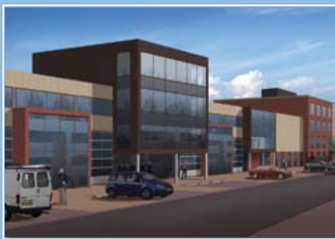
Kantoorstorens aan de noordzijde

Direct achter de kantoren, welke zijn gelegen op de koppen van fase 1, zijn bedrijfsunits ontworpen met een vrije hoogte van ca. 8,00 m die tevens zijn voorzien van entresolvloeren.